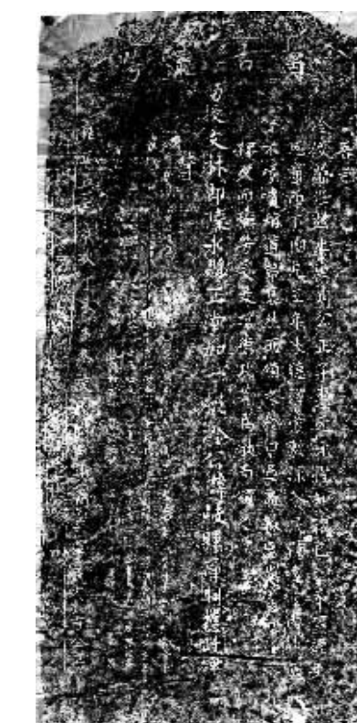
图为“廉明德政”碑拓片

周伟民教授说,海南的碑与碣、匾、铭、额一样,都是彰显海南历史的不可替代的第一手资料;它们可以资考证,补史阙,可辨旧说之诬。事实正是如此。“廉明德政”碑的留存,的确起到了“补史阙”的作用,使得人们在几百年后的今天,尚能知道陵水还有这么一位让当时老百姓肯定的好知县。(本报陵水10月30日讯)