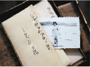
本栏图片均为《海角七号》剧照

在 2008 年里发生过太多事情，让人沉重到无法喘息。《海角七号》是中国人需要的那种故事，所以应该在年内看到。