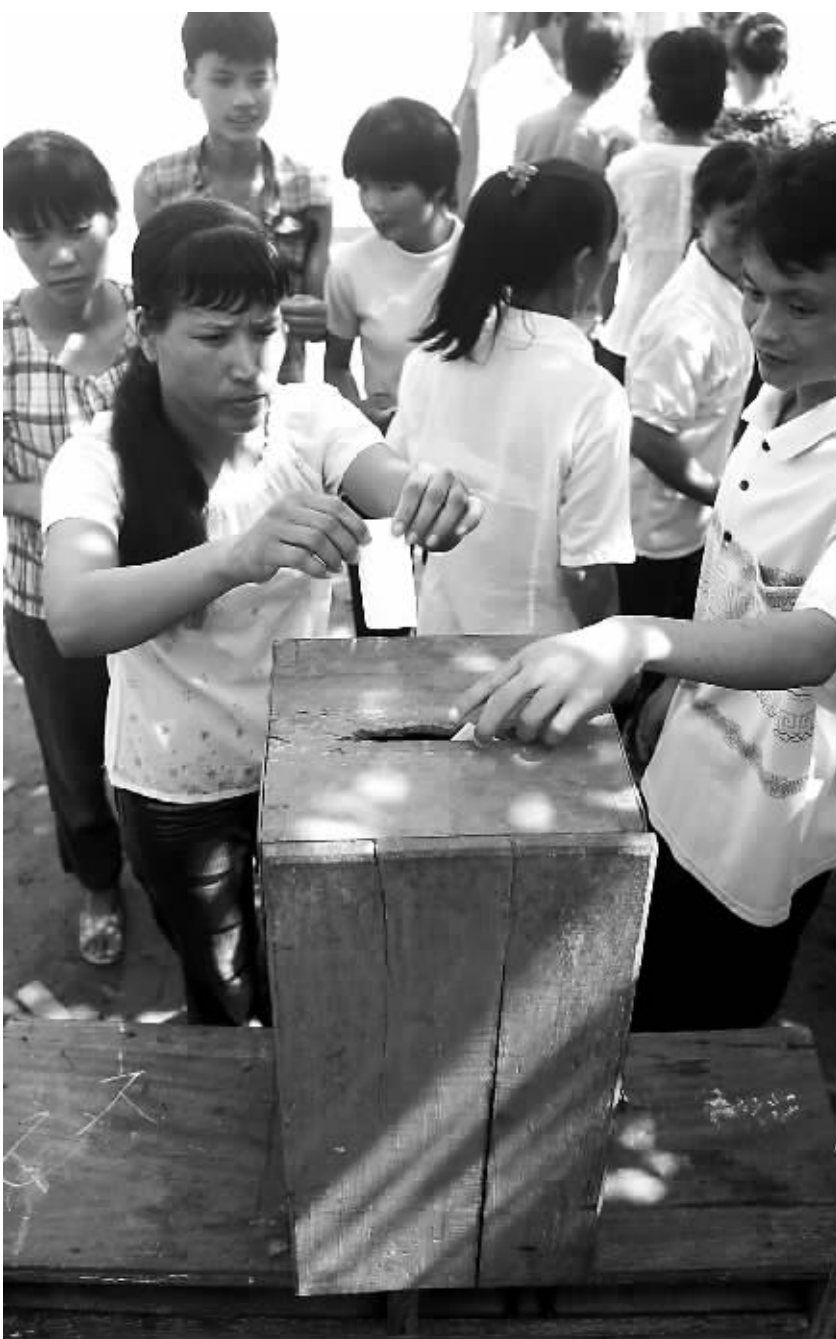
东方市三家镇代姆村村民在一次村委会选举中,投下自己庄严的一票。