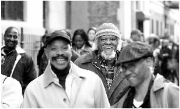
11月4日，在美国纽约市哈莱姆地区，人们排队参加投票。

美国民主党总统候选人贝拉克·奥巴马用自己的亲身经历向世人诠释了何谓“美国梦”。奥巴马在平民单亲家庭长大，毕业于哈佛大学法学院，涉足全国政坛不足4年即成为美国主要党派首位非洲裔总统候选人，在与对手共和党老将约翰·麦凯恩的角逐中多数时候占据优势，白宫似近在咫尺。