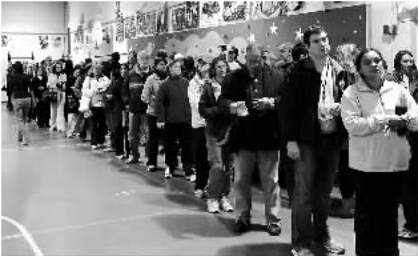
11月4日，美国弗吉尼亚州阿灵顿县克伊小学投票站。