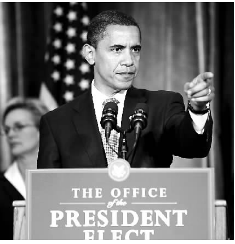
11月7日,奥巴马举行当选后首次新闻发布会。

美国国内汽车销量10月份下降32%,创出17年来月度销量最低,为83.8万辆。其中,通用汽车10月销量大跌45%,为16.9万辆,而皮卡、SUV和厢式车销量跌幅更高达53%;福特销量下跌30%,至13.2万辆;克莱斯勒下降35%,至9.5万辆。销量下降、亏损增加以及补偿信贷部门因降低购车者贷款利率而造成的损失,目前各大汽车制造商的现金消耗正在加速。通用汽车第三季度消耗现金69亿美元,公司警告说仅剩的162亿美元现金可