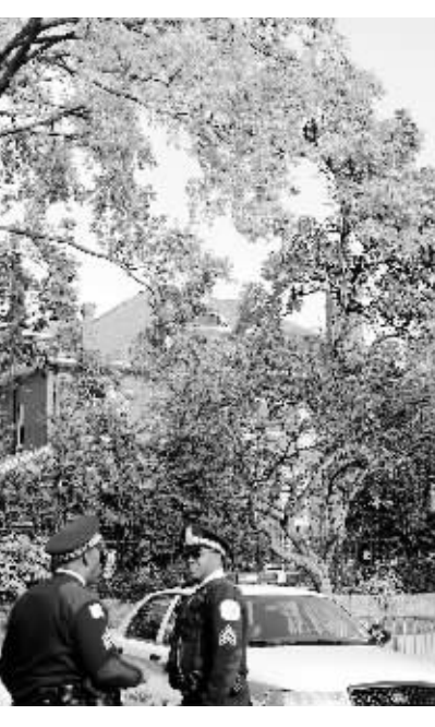
11月7日,美国警方在奥巴马位于芝加哥市南部的住宅外执勤。

伊朗新闻电视台8日援引拉里贾尼的话说,奥巴马的言论是在继续美国政府以往的错误政策,没有表现出要在中东地区问题上作出改变。