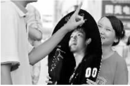
2007年7月17日,海口明珠广场前,“花生”团在为陈楚生拉票。

2007年,来自海南的陈楚生一举夺得“快乐男声”总冠军。从一个默默无闻的酒吧歌手,到名扬全国,陈楚生走过了一段不平常的日子。陈楚生的歌迷,自发采取多种方式关注和支持陈楚生。这些人有一个共同的名字——