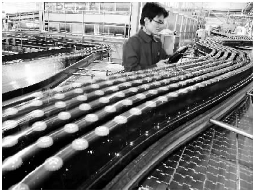
力加啤酒生产线。

老林50多岁,是土生土长的海口人。老林回忆说,1990年代初,海南还没有真正意义上的本地啤酒。那时,“蓝带”,“生力”和“皇妹”几个啤酒品牌三分天下。但力加进入海南后,市场上繁多的啤酒品