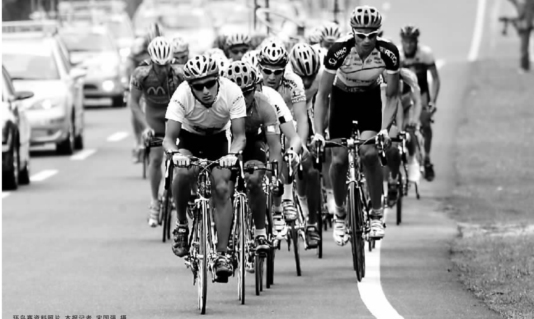
环岛赛资料照片

在观看自行车比赛前，观众应了解自行车比赛的特点和相关知识，做到注意赛场秩序和适时保持安静。在自行车比赛开始(集体出发项目例外)时，运动员需要根据在倒计时电子提示音发出出发。这时现场的观众应保持安静，以免干扰或影响运动员的比赛出发。 对于沿途观赛的观众来说，首先要选择一个安全的位置观看比赛。在赛道中经常有一些危险地段，或是急转弯地形，以及运动员竞争比较激烈的地段。运动员在激烈的竞争中就存在着一定的危险性，如果运动员在高速状态下发生侧滑、摔倒等事故，势必威胁周边观众的安全。所以，观众在沿途观赛时一定要不要超越隔离区，以保证自身的安全。 其次，观看自行车比赛过程中一定要听从赛场人员的指挥，不要随意冲入场内或赛道。因为公路自行车赛道上不仅有高速行驶的自行车，还有保障竞赛的各种机动车辆，所以，观众突然冲进或穿越赛道的做法是十分危险的。一旦发生阻挡运动员或队车事故，轻则影响运动员的比赛成绩；重则造成严重的人身伤害事故。 在观看山地车比赛时，观众不能接触或帮助运动员，更不能向运动员的身上和车上喷水。因为规则规定参赛选手在比赛中不得接受外界帮助。(海文)