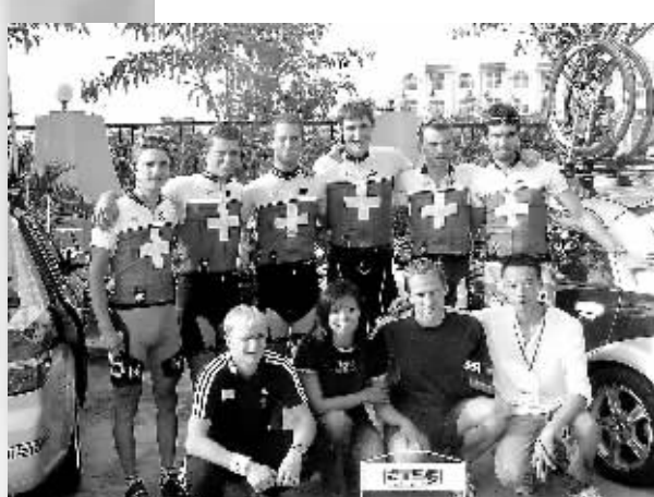
瑞士国家队在三亚留影。