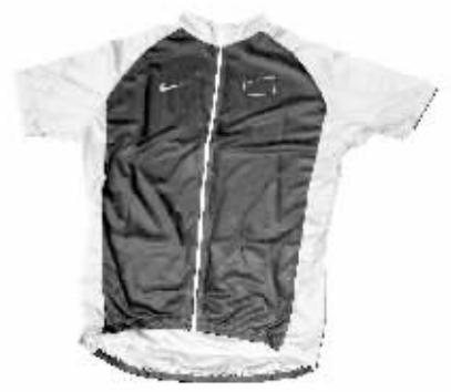
中国国家队队服。