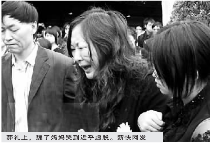
葬礼上，魏了妈妈哭到近乎虚脱。