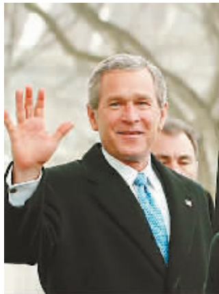
美国现任总统小布什