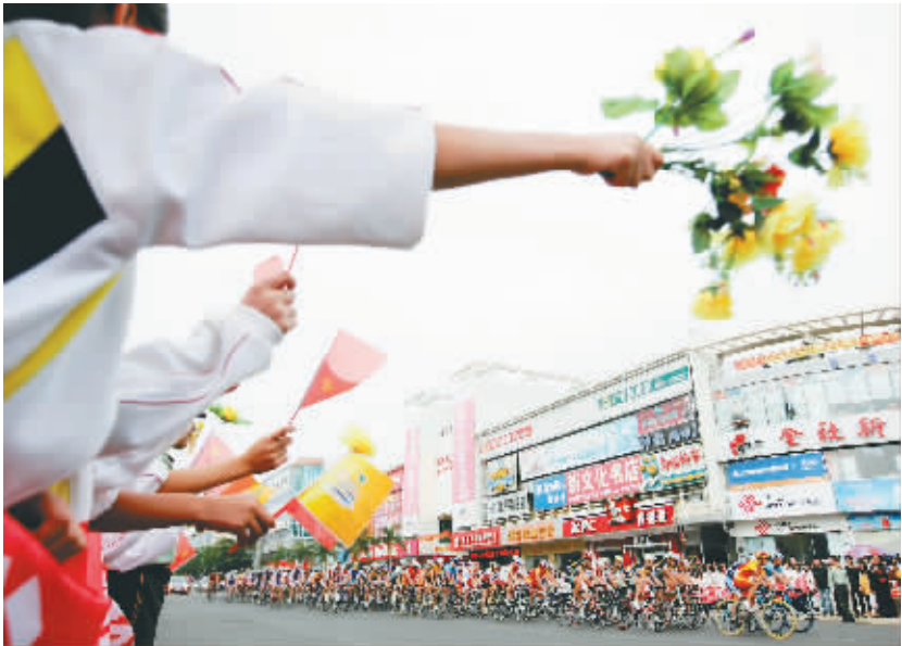
11 月 13 日,万宁万城的学生为参加环岛赛的车手喝助助威。

起点:文昌维嘉国际大酒店 终点:海口人大会堂广场前 途经地与路段:文昌维嘉酒店—和平北路—文西路—S205—新合镇—南阳农场—蓬莱镇—黄竹镇—黄竹立交—S302—龙门镇—雷鸣镇—定安县—S202—龙州乡—新竹镇—G224—新吴镇—永发镇—永兴镇—海秀镇—滨海大道—海口人大会堂广场前