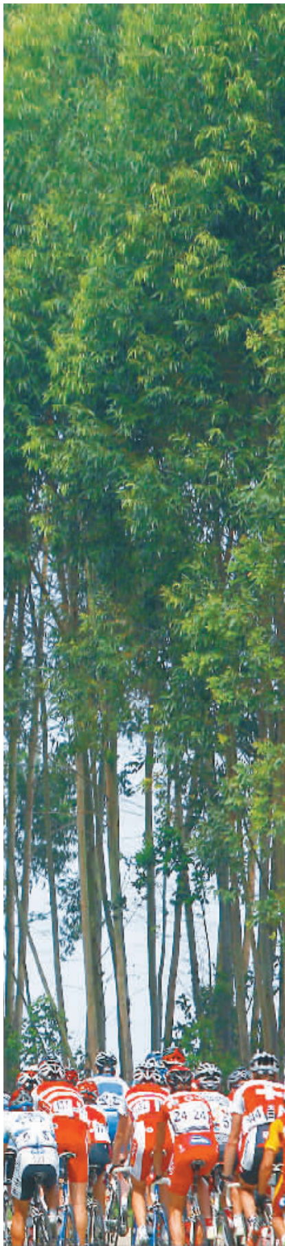
13 日,参赛车手骑行在文昌境内。