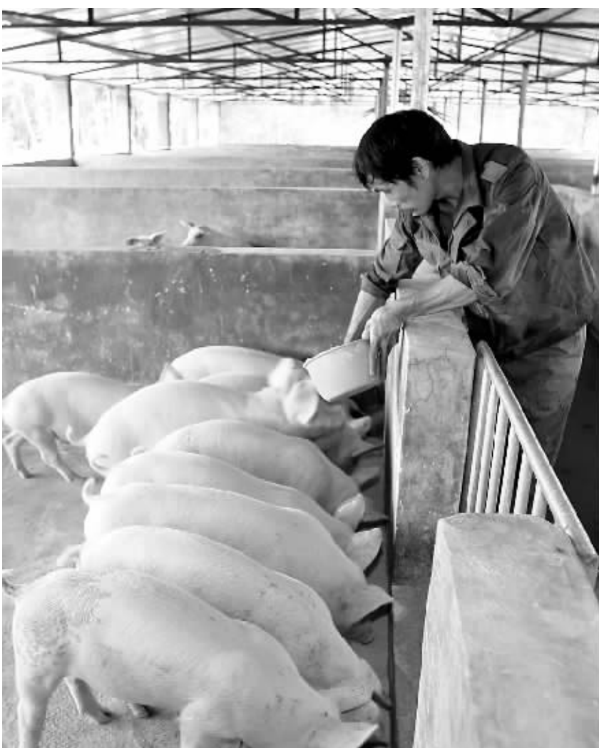
猪价高位回落属于正常现象,只要管理得当,养猪还有钱赚。

面积亏损,不会大量淘汰母猪;第二、经过多年发展,海南养殖规模化水平不断提高,养殖户获取市场信息、抵抗风险的能力大大增强;第三、政府有扶持政策,如能繁母猪补贴、母猪保险等;第四、饲料已经下调,玉米从最高峰每吨2200元降到1800元,豆粕从每吨5200到4200元,各方面信息显示,饲料价格还将持续下调。因此,未来市场会有一些波动,但不会像上一轮那样剧烈。而且随着元旦、春节临近,近期猪价价