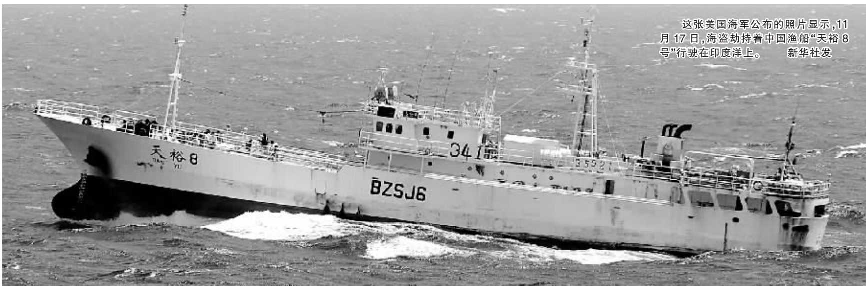
这张美国海军公布的照片显示, 11月17日, 海盗劫持着中国渔船“天裕8号”行驶在印度洋上。