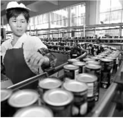
工人正在将刚生产出来的椰子汁饮料打包装箱。

自 1986 年 1 月起,椰树人率先在国有企业中推行“破三铁”、“科技重奖”等改革,调动企业和职工的积极性,极大提高了企业经济效益和竞争力。一个濒临破产的工厂,发展成为年产值近 20 亿元的中国最大天然植物蛋白饮料生产企业。