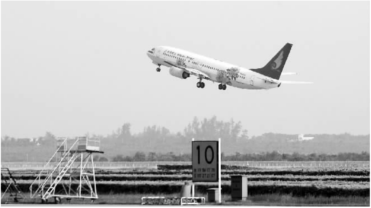
落地签证,极大的方便了世界与海南的交流合作。

此后,在省委、省政府的重视和支持下,经过多方面的积极努力,公安部同意在原有口岸签证政策的基础上,进一步放宽我省口岸签证的条件。从 1990 年 10 月起,准予来我省办理落地签证的人员不限于与