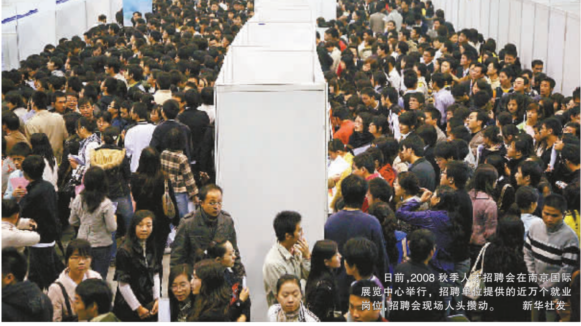
日前,2008 秋季人才招聘会在南京国际展览中心举行,招聘单位提供的近万个就业岗位,招聘会现场人头攒动。

■2007 年我国城镇单位在岗职工平均工资为 24932 元,是 1978 年的 40.5 倍,年均增长 13.6%。 ■前 10 月全国城镇新增就业人员 1020 万人,提前完成全年目标。(据新华社电)