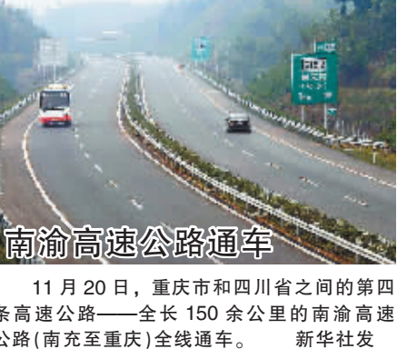
南渝高速公路通车

新华社北京 11 月 20 日电 (记者荣燕 常璐)外交部发言人秦刚 20 日在例行记者会上表示,中国质检部门在出口消费品检验方面完全符合美方对第三方检测机构的资质要求,希望美方能够将中国国家质检总局出具的检验证书作为美方认可的检验证书。 秦刚是在回答记者有关美国要求中国输美食品等需经第三方检测的问题时作出上述表示的。 据悉,美国近期出台新修订的消费安全法案引入了第三方检测的制度。美国卫生和公众服务部部长莱维特日前在北京表示,美国食品药品监督管理局要依靠独立的第三方机构,从源头上对出口美国的产品进行安全检查,这些机构可以是私人商业机构,也可以是政府下属机构,但都必须通过美国食品药品监督管理局认证和审批。 秦刚表示,鉴于中国质检部门对输美产品的法检制度具有特殊性,希望美方能够将中国国家质检总局出具的检验证书作为美方认可的检验证书,这样可以便利中美双方的通关程序,保证输美产品的质量。 秦刚说,希望中美双方今后在食品安全和产品质量领域能够相互尊重,照顾到彼此利益和关切,通过平等协商来处理有关问题。