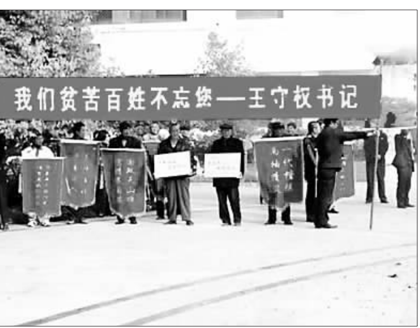
网上流传的送旗赠匾图片

“西楚刀客”的博客，截至12月2日的浏览量就达到了36461人次，跟贴评论数百条。博文随后被包括宿迁论坛在内的当地及外地论坛、博客广为转载，更引起了网民的各种猜测。