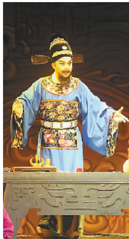
本文照片均为《海青天》剧照

《海青天》写的是海瑞在江西兴国县任县令时的一段故事,歌颂了海瑞不畏强权、刚正不阿、秉公断案、严惩凶徒、为民作主的青天精神,所以被当地黎民百姓称为海青天。在剧中饰演海瑞的吉劲旅,饰演方红莲的刘秀兰等主演们的出色演出,多次赢得全场观众的热烈掌声。 省政协副主席张海国观看了演出。