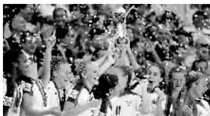
12月8日,美国队夺得20岁以下女足世青赛冠军。图为美国队捧杯庆祝。