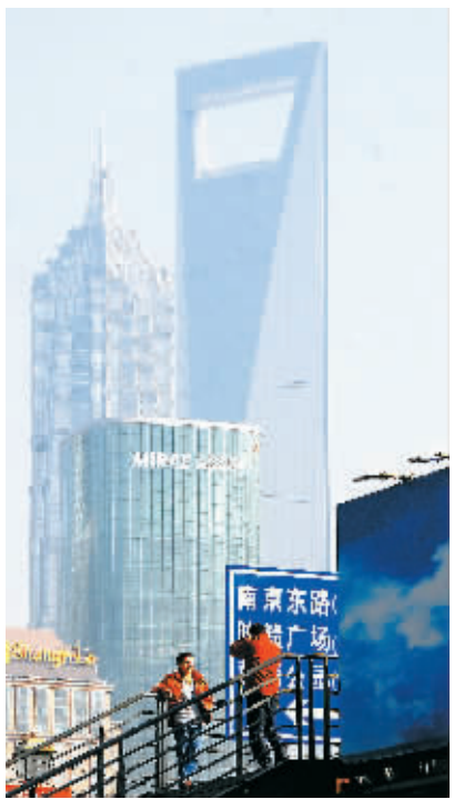
↑12月9日,寒潮过后的申城气温迅速回升,最高气温接近20摄氏度,市民纷纷出门享受冬日阳光。