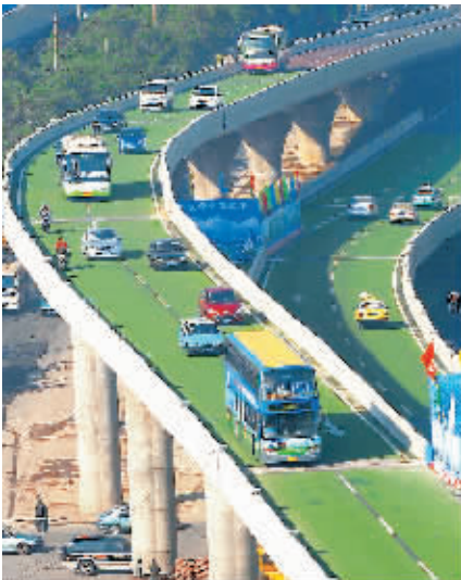
武汉彩色路面高架桥通车 12月9日,湖北省武汉市卓刀泉高架桥通车。这条高架桥为武汉市首条彩色路面高架桥,路面采用了彩色陶瓷颗粒新型材料,具有防滑、耐磨、耐腐等特点。图为车辆在武汉卓刀泉高架桥的绿色“跑道”上行驶。

据新华社北京12月9日电 (记者张晓松)为了从严治理审计队伍,保证审计机关在经费上不依附于被审计单位,审计署9日公布了《审计署关于加强审计纪律的八项规定》,要求署机关及其派出机构自2009年1月1日起遵照执行。 ——不准由被审计单位支付或补贴住宿费、餐费。 ——不准使用被审计单位的交通工具、通信工具等办公条件办理与审计工作无关的事项。 ——不准参加被审计单位安排的宴请、旅游、娱乐和联欢等活动。 ——不准接受被审计单位的任何纪念品、礼金、消费卡和有价证券。 ——不准在被审计单位报销任何因公因私费用。 ——不准向被审计单位推销商品或介绍业务。 ——不准利用审计职权或知晓的被审计单位的商业秘密和内部信息,为自己和他人谋利。 ——不准向被审计单位提出任何与审计工作无关的要求。 审计署有关负责人表示,以上规定将连同审计(调查)通知书送达被审计单位,接受被审计单位对审计组和审计人员的监督;同时向社会公布,接受社会各界的监督。 对违反上述规定的,对有关责任人视违规情节轻重进行批评教育、诫勉谈话、通报批评、组织处理或按有关规定给予纪律处分;涉嫌犯罪的,移送司法机关追究法律责任;侵占被审计单位经济利益的,如数退还;有关责任人在所在单位领导还要登门赔礼道歉。