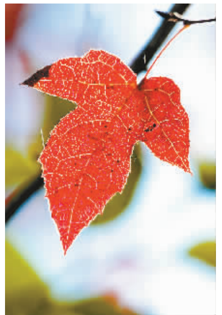
红叶也需绿叶衬。