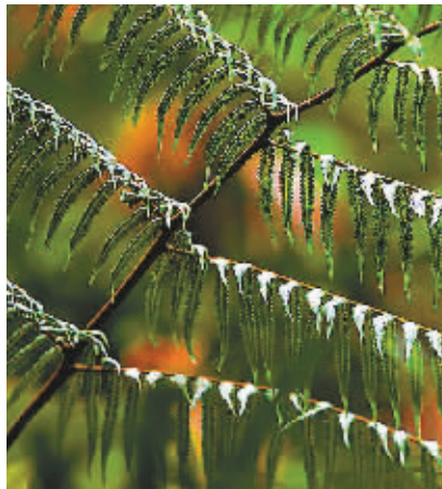
五指山多姿多彩的绿色植物。