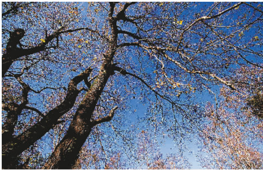
冬日五指山,海南原来也有如此富有北方风情的美景。

“目前有香山红叶节,巫山红叶节等等,五指山红叶节不能简单的重复,不是节日的复制,而是中部生态旅游的一个品牌,让红叶节吸引大批客人,同时融入黎苗文化,相信这个节日能成功,很具有市场竞争力”,康泰国际旅行社副总经理张强说。