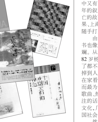
《民间记忆》系列丛书