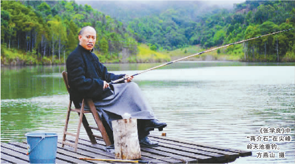
《张学良》中“蒋介石”在尖峰岭天池垂钓。