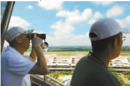
冯小刚导演一行在海口美兰机场拍摄《非诚勿扰》。

出亚马逊》,是根据真人真事改编拍摄的一部现代军事动作片,2002年上映后广受好评。然而,鲜为人知的是,这部影片并非在故事发生地——南美洲亚马逊流域拍摄,而是将其“搬”到了海南尖峰岭原始森林。