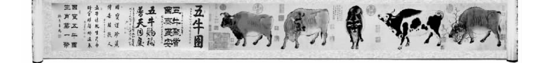
巨幅黄金卷长达3.68米,比一层楼还高。既有千年国宝《五牛图》原版真迹,更有6位当代文博泰斗的题词和清朝乾隆皇帝的墨宝,等于是“黄金卷上镶了钻石”。(本图片未完全展示,亲临现场,极为震撼!)

故宫镇馆国宝《五牛图》为新中国中的国宝,深藏故宫50年从未露过面,普通人更是难得一见,哪怕是亿万富翁。据央视鉴宝栏目介绍:南京的一位收藏家持有——