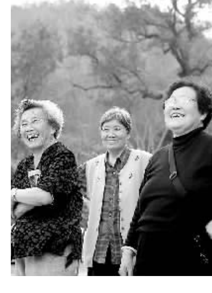
2008年12月21日,来海南“猫冬”的几位安徽老人在五指山观赏红叶。

改革开放30年,海南发生翻天覆地的变化,其中最显著的变化是农业、农村和农民。本报“新起点上再出发”专题,从土地流转、税费改革、热带农业成长、新型农业组织、文明生态村建设等5个方面,回顾了海南农业改革的历程,展示了农业发展的成就,展望了“三农”进一步改革的道路。