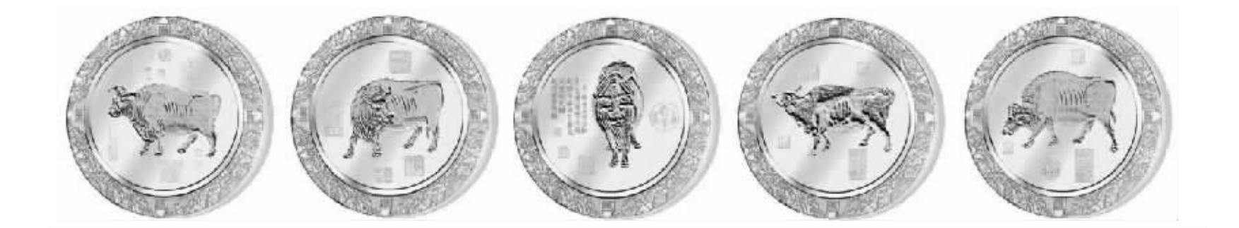
故宫镇馆国宝《五牛图》上的五头牛,是千年来最珍贵的、寓意最美好的“牛”。五牛齐聚在贺岁生肖金币上,祝愿国泰民安,与新中国60年的非凡历程和“祖国60华诞”的崇高祈福,简直是绝配。

核心提示 国家破例将故宫镇馆国宝《五牛图》中的五头牛,分别铸成5枚可流通、带面值的法定生肖金币“垦荒牛金币、好运牛金币、旺家牛金币、招财牛金币、如意牛金币”。并首次将千年国宝《五牛图》按1:1的比例,原版真迹的用黄金浇铸成长达3.68米(足足一层楼高)巨幅黄金卷,与5枚纯金生肖币配套发行,共耗用999纯黄金35.5克。故宫博物院前副院长谢方、中国收藏家协会会长阎振堂等6位文博界泰斗为之亲笔题词,尊称为“生肖第一币”。