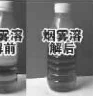
烟毒溶解 解前 解后