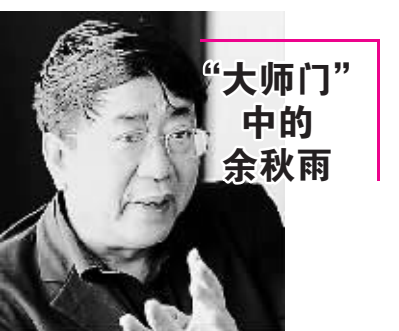
“大师门”中的余秋雨

经典的《红与黑》所描述的时代已经离我们远去,但我们身边的“红人”从来没有缺少过。在这个网络触角无所不在的时代,每天都在创造有人一夜成名,有人一落千丈的神话。大众需要“红人”,历史需要“红人”。2008文化圈的于连们依然在上演精彩好戏,虽然有些已经是“老于连”了。 ——编者