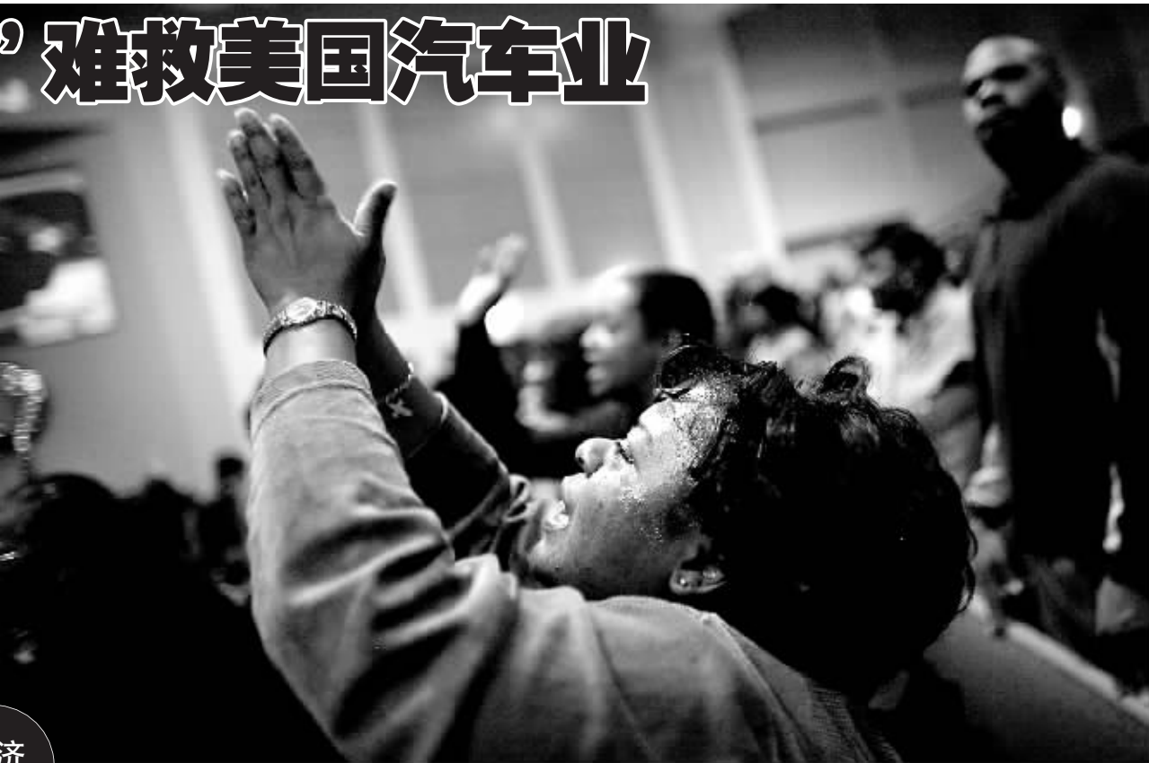
↑日前,在美国汽车城底特律进行的一场题为“混合动力的希望”的推介活动上,一名妇女为美国汽车制造业的未来祈祷。