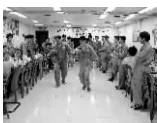
在寂寞的钻井平台工作之余，大家也学会了“找乐子”。

公司从美国引进了三台透平天然气压缩机组，将海上的天然气处理后直输陆地。这三台机组设备技术复杂，自动化程度高。那段时间，我们白天忙调试，晚上忙学习，没白没黑地连轴转，有时饭都顾不上吃一口。在大家的努力下，调试工作提前完成。