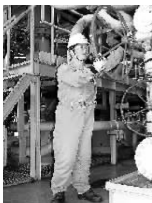
葛爱将形容平台就是海洋上美丽的城堡，城堡就是温暖的家。