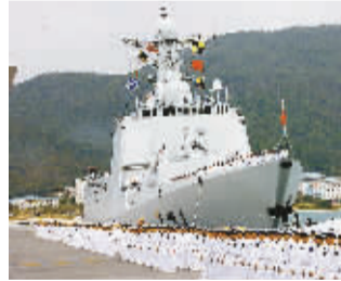
12月26日,海军出征军舰在三亚军港准备起航。

中国此次护航,是中国首次使用军事力量赴海外维护国家战略利益,是中国军队首次组织海上作战力量赴海外履行国际人道主义义务,是中国海军首次在远海保护重要运输线安全。