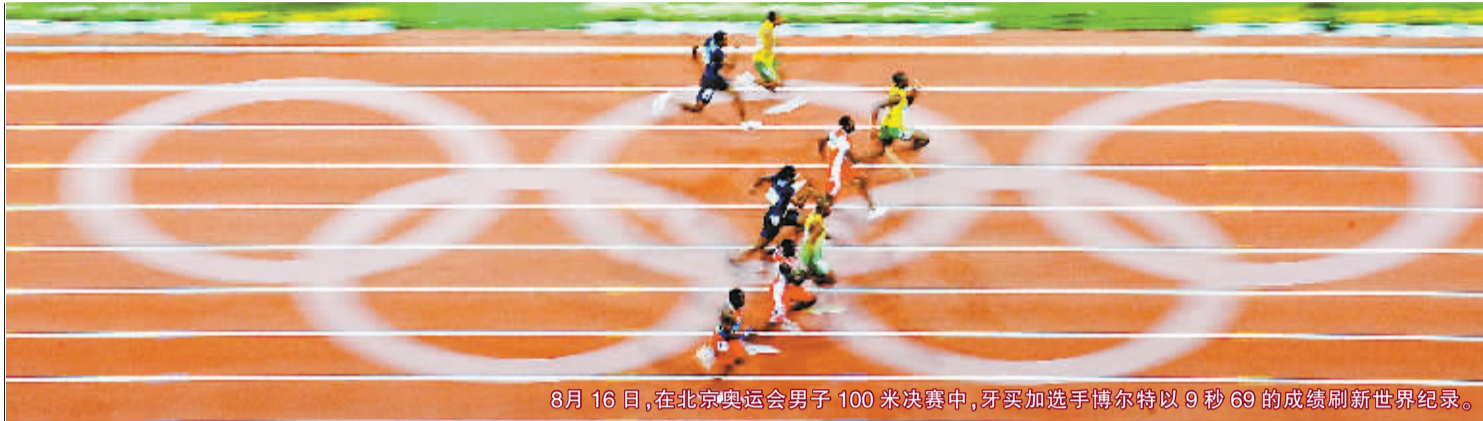
8月16日,在北京奥运会男子100米决赛中,牙买加选手博尔特以9秒69的成绩刷新世界纪录。

联合国减灾战略秘书处执行主任萨尔瓦诺称,中国政府迅速有效的救灾行动为区域和世界提供了一个典范。联合国秘书长潘基文高度评价中国人民勇敢无畏和坚韧不拔的伟大精神,高度评价中国领导人将以人为本的理念落到实处,在抗震救灾中展示出的超凡领导能力。