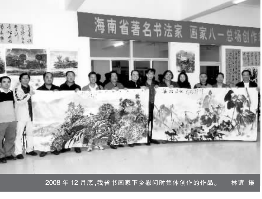
2008年12月底,我省书画家下乡慰问时集体创作的作品。

8月,举办庆祝建省20周年全省书画展,协办省政协举办“纪念改革开放30周年书画作品展”;举办“紫园杯”海南省军警书画作品展;举办海南省第六届刻字艺术展,