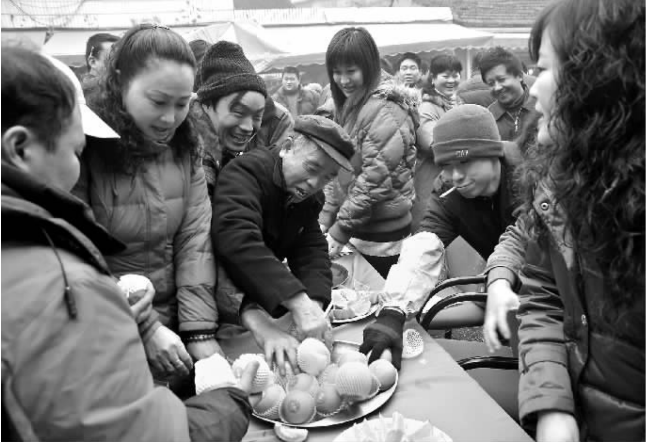
1月5日,上海市中山西路水果批发市场里,市民和水果销售商争相品尝海南澄迈福橙。