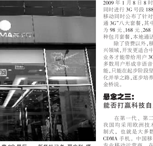
1月7日,行人经过中国移动在北京的一家3G展厅。

虽然电信行业已讨论多年,但3G对于普通百姓仍是一头雾水。同第一代移动通信的语音通话、第二代移动通信在语音