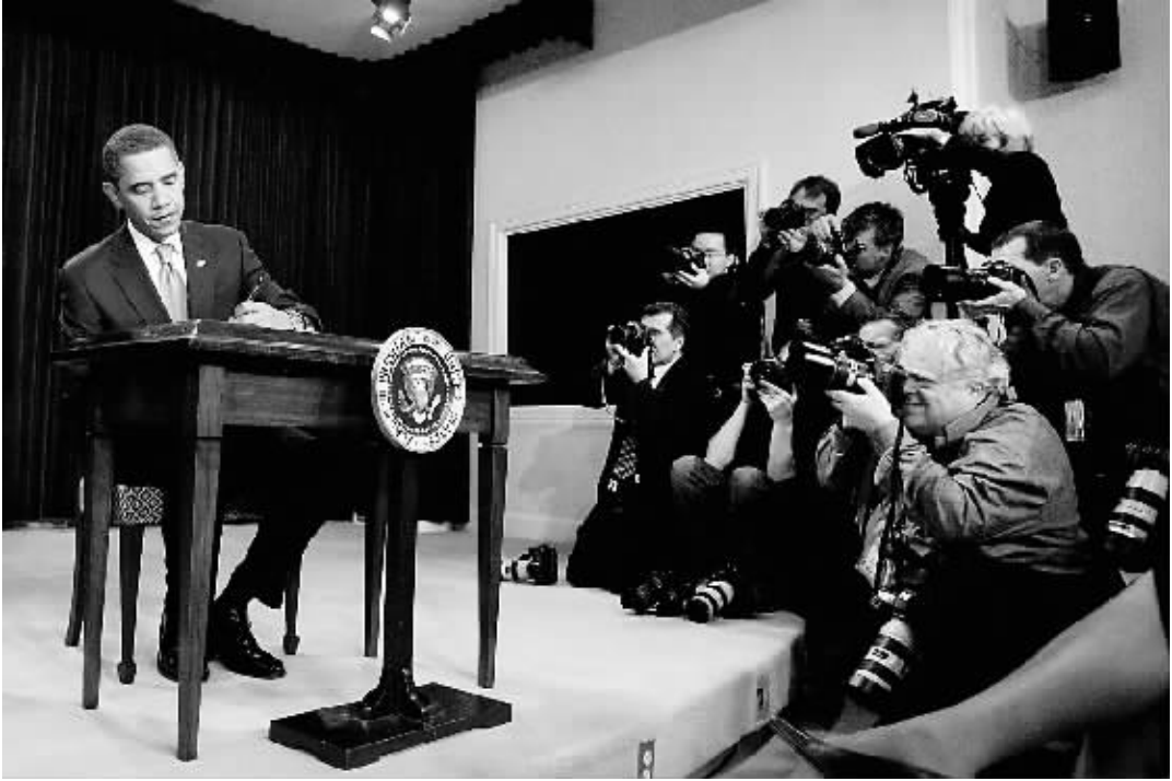
1月21日，奥巴马（左一）在华盛顿白宫的艾森豪威尔行政办公楼内签署一道行政命令。