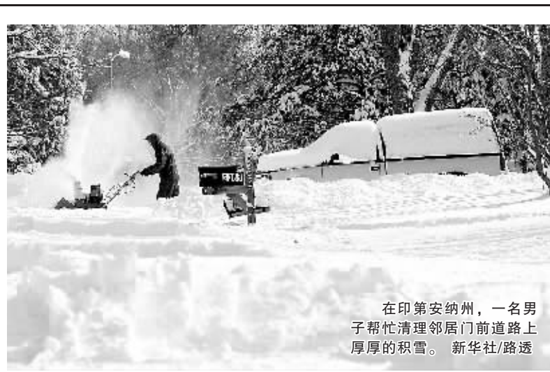
在印第安纳州,一名男子帮忙清理邻居门前道路上厚厚的积雪。