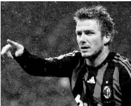
2月8日，在意甲联赛第23轮比赛中，AC米兰队主场1比1战平雷吉纳队。图为贝克汉姆在比赛中。

据新华社伦敦2月7日电（记者李丽）英格兰主帅卡佩罗当地时间7日晚公布了11日与西班牙队进行友谊赛的23人大名单，贝克汉姆重新入选，鲁尼则因伤缺席。 凭借近来在AC米兰队的不俗表现，小贝重新赢得了卡佩罗的“欢心”。此次入选意味着贝克汉姆将第108次身披英格兰战袍，同英格兰足球史上摩尔保持的纪录持平。 鲁尼自1月份腿伤以来一直在养伤，虽然近日有望复出，但卡佩罗还是没有冒险。而另一名锋线尖刀赫斯基虽然榜上有名，但他在7日的英超联赛中受伤中途下场，还不知能否随队赴西班牙。杰拉德之前就因伤已确定无法出征。西汉姆的前锋科尔顿·科尔和阿斯顿维拉的中场米尔纳都是首次入选英格兰队。