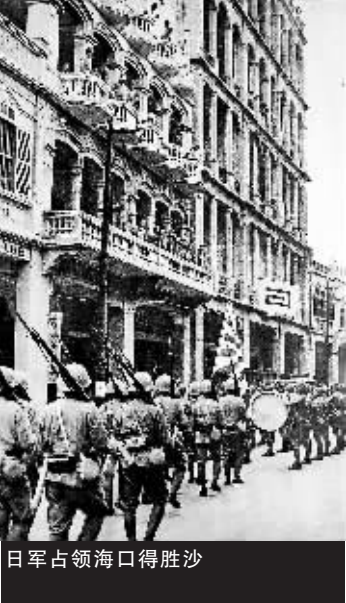
日军占领海口得胜沙