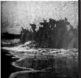
1939 年 2 月 10 日凌晨在澄迈湾登陆的日军陆军部队

张兴吉:访日交流学者,2000 年考入北京大学中文系攻读古典文献学。2003 年获博士学位。现为海南师范大学文学学院教授,主要从事古文献学和海南地方历史文化的研究。曾出版《琼海旧志艺文会要》(合著),发表《中国旧时代官僚式学术研究》等学术论文 20 余篇。