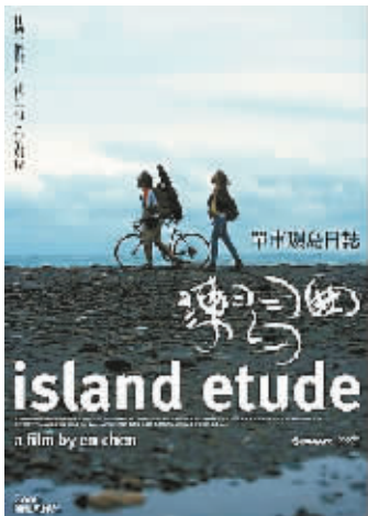
《练习曲》 导演:陈怀恩 上映日期:2006 年 11 月 22 日

德克萨斯的巴黎(1984) 导演:维姆·文德斯 主演:哈利·戴恩·斯坦通 娜塔莎·金斯基 法国