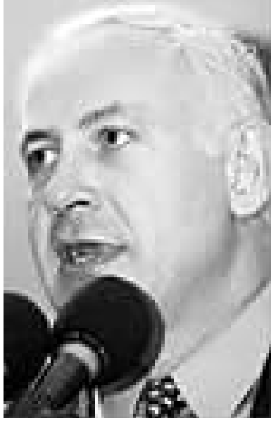
内塔尼亚胡 老牌“鹰派”重回归

民调结果显示,利库德集团领先其他三个政党,有望获全部120个席位中的25席至27席。这一政党领导人本雅明·内塔尼亚胡成为下任总理热门人选。内塔尼亚胡现年59岁,在巴以问题上以“鹰派”立场著称。 按照他的观点,推进中东和平进程,重点在于改善巴勒斯坦人的日常生活,而不是解决耶路撒冷地位、巴难民回归、犹太人定居点等国际公认的问题。 他对巴勒斯坦伊斯兰抵抗运动(哈马斯)态度强硬,认为应该彻底打垮这一组织。 内塔尼亚胡从政经验丰富,取得过令人惊叹的胜利,也遭受过耻辱性的惨败。1996年,他出人意料地击败工党的西蒙·佩雷斯,占据总理一职,尽管工党当时因为前总理伊扎克·拉宾遇刺身亡获得大量同情票。 2006年,利库德集团内部出现分裂,阿里埃勒·沙龙离开,牵头组建前进党。 当年选举中,内塔尼亚胡领导的利库德集团遭到重挫,仅获12席。他随后3年苦心经营,利用民众对政坛腐败、哈马斯火箭弹袭击等方面的不满情绪,使利库德集团重新接近权力中心。 内塔尼亚胡能说一口流利的英语,先前就读于著名的美国麻省理工大学,获建筑学学士和商业管理硕士。 他与第三任妻子育有两个孩子,与第一任妻子有一个女儿。