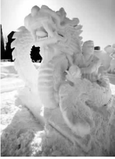
2月9日,在第60届日本札幌冰雪节上拍摄的中国香港艺术家创作的“舞龙”雪雕。这座位于主会场大通公园的雪雕以其浓郁的中国元素,备受游人瞩目。据了解,这也是中国香港艺术家第34次参加札幌冰雪节。