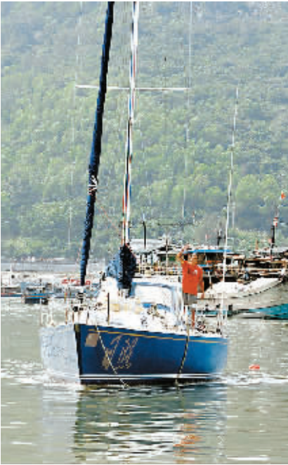
翟墨抵达三亚港。