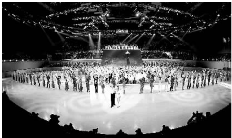
图为大冬会开幕式上的表演。

本届冬奥会的冰上项目将在哈尔滨举行。黑龙江和哈尔滨自2005年获得本届世界大冬会举办权以来,为办好大冬会倾注了巨大热情和精力,投入30多亿元新建和改造场馆等基础设施建设项目51个,并组建了3000名赛会志愿者和10万名城市志愿者队伍。