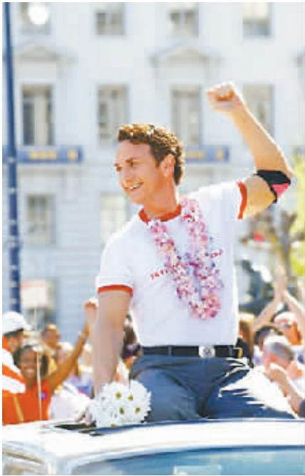
主演: 米尔克(2008) 导演: 格斯·范·桑特 西恩·潘 乔什·布洛林 詹姆斯·弗兰科