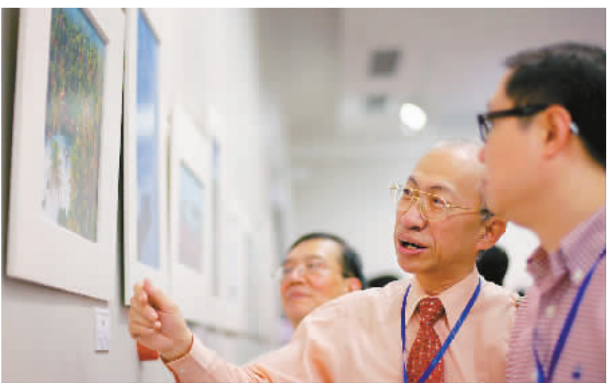
观众在欣赏展览作品。