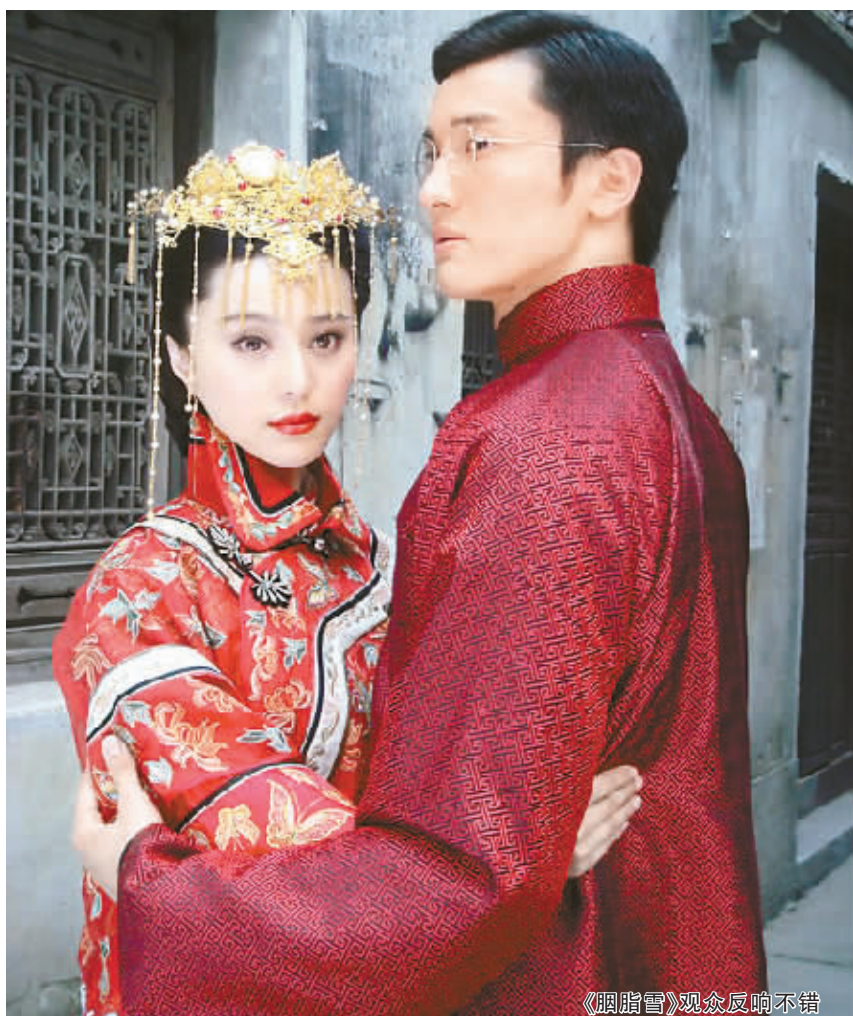
《胭脂雪》观众反响不错

同时,于正也将自己制作的《大清官》、《最后的格格》、《胭脂雪》等剧集收视状况、获奖情况与张纪中制作的几部大型武侠剧相比较,以真实数字说明了这几部剧在市场竞争、大众口碑、艺术水准等方面的压倒性胜利。(钟禾)