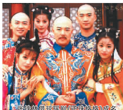
张铁林借《珠光宝气》成名

而这个理念真正散播开,是在某电视台的谈话节目中。国内知名制作人张纪中听闻一同参与谈话节目的编剧阐述这个意图提高编剧地位的观点时,反应颇大:“绝对不可能嘛!想得简单!”张纪中认为,作为一个“孤独的行者”,编剧只要撰写出好剧本即可,不应该过多的插手其他方面。影视剧的拍摄是一个复杂的、需要团队