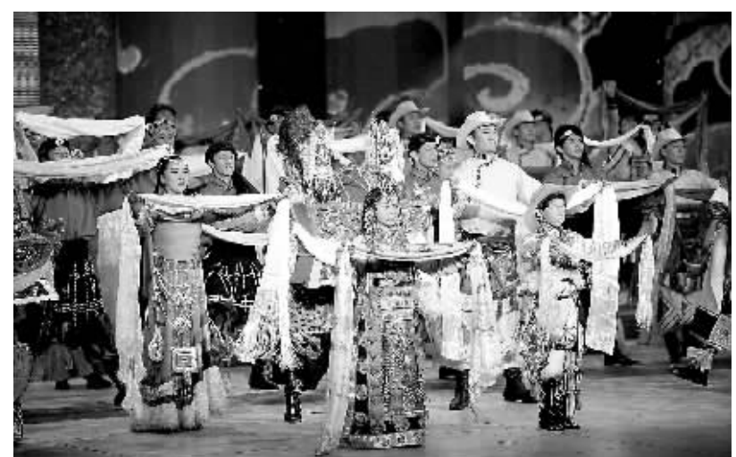
3月28日,由中央统战部、全国政协办公厅和中央电视台主办的“走向阳光——庆祝西藏百万农奴解放50周年文艺晚会”在北京举行。晚会展现了50年来西藏在中国共产党的领导下发生的翻天覆地的变化。

今年1月19日,西藏自治区九届人大二次会议一致通过决议,确定每年3月28日为西藏百万农奴解放纪念日。