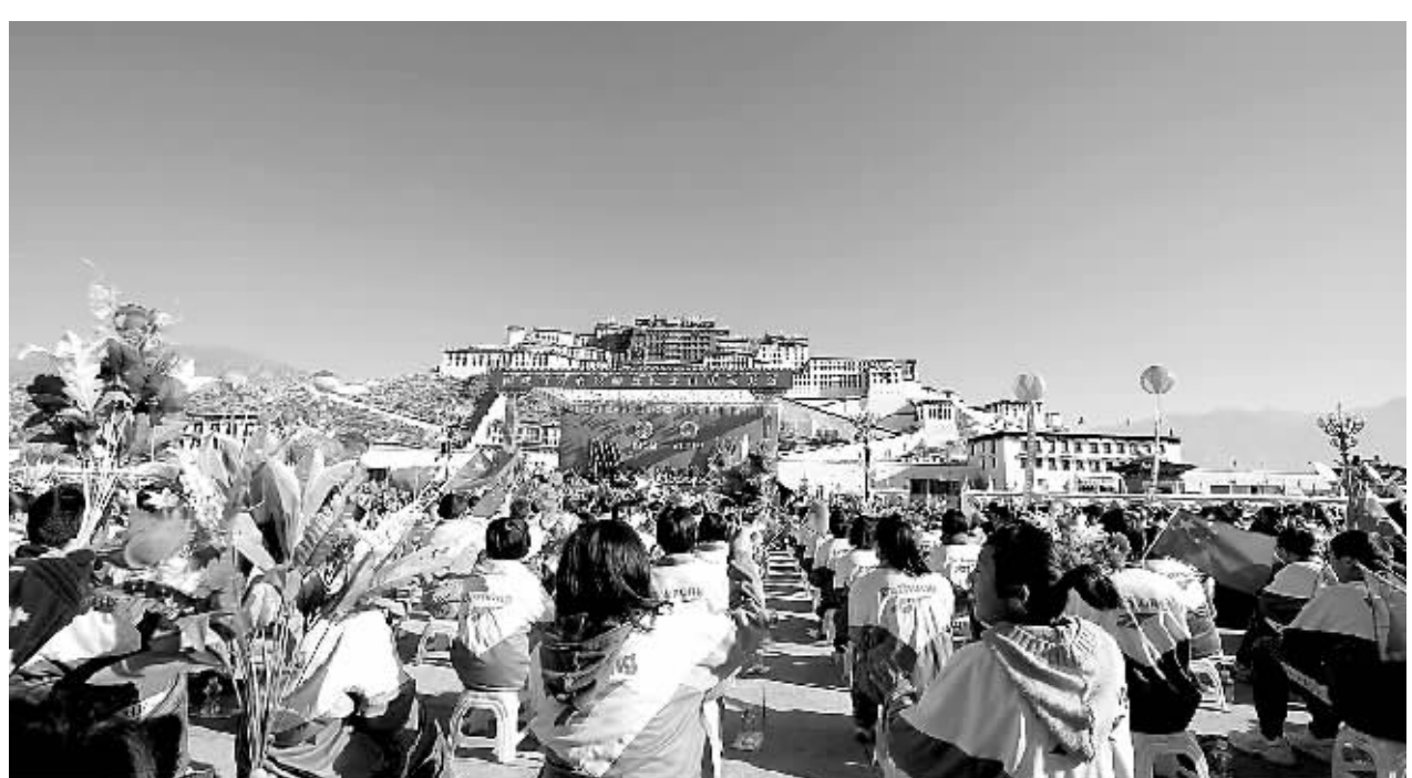
3月28日10时,西藏自治区在拉萨布达拉宫广场举行西藏百万农奴解放纪念日庆祝大会。这是庆祝大会现场。

张庆黎说,彻底埋葬封建农奴制、完全解放西藏百万农奴,是西藏历史上最为广泛、最为深刻的社会变革,是世界反封建运动的重要里程碑,是国际人权事业的重大进展,为西藏的发展繁荣开辟了崭新的道路。民主改革50年来,西藏已经站在新的历史