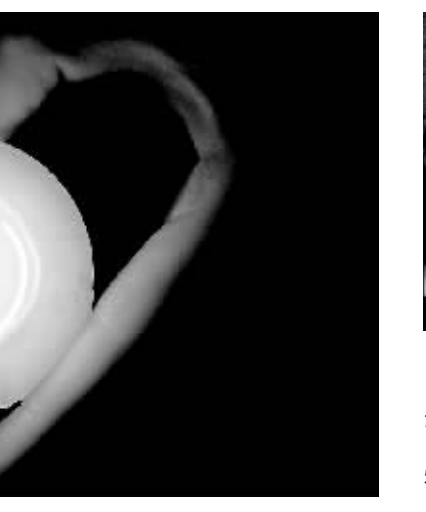
3月28日,长春市一名小朋友在将蜡烛托在手中。