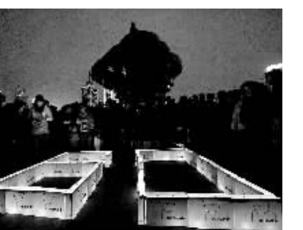
3月28日,青岛市民在五四广场上摆出一小时“60”分钟的造型参加“地球一小时”活动。当晚8时,青岛市西起团岛,东至奥帆中心,包括沿海一线在内的市内四区的景观灯全部关闭,为星光“让路”。