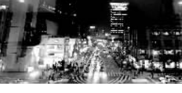
这张拼版照片显示的是北京鸟巢、水立方关灯的过程。新华社发