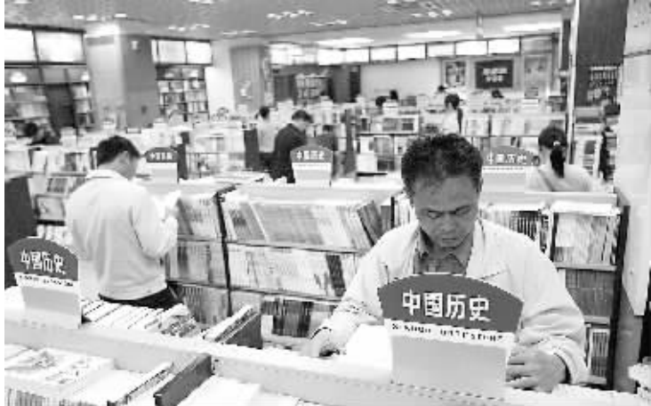
在海口解放西路的新华书店,读者正在挑选图书。

据省图工作人员介绍,近来,文学类书籍很受读者欢迎。在省图书馆社科类借阅室,股民张先生告诉记者,他准备借几本文学作品看看,放松心情。“金融危机下人们