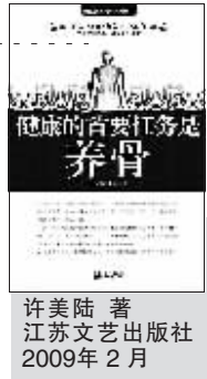
许美陆 著 江苏文艺出版社 2009年2月

本书是“国医健康绝学”系列丛书之十二;由国际中医骨伤学会与美国脊椎矫正学会认证医师、台湾资深脊椎理疗师许美陆亲自撰写。她将20年从医所得,汇集最简单易学的养骨健康法。另外,作者还随书特别赠送一张“全形骨骼与内脏神经对照图”,方便读者循着骨骼找病源,自助养骨防病。