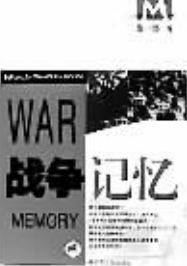
解放军文艺出版社 作者:张正隆