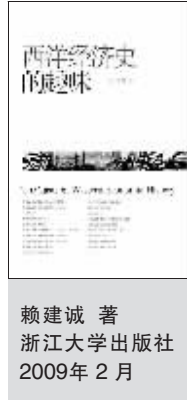
赖建诚 著 浙江大学出版社 2009年2月

本书以饶有学理兴味的生活实例,勾勒并探求西洋经济史的发展图像,将历史事件重新解读、剖析:为什么计算机键盘不依 ABCD 排列?股市的红绿与天气晴雨有没关系?为什么 1866-1868 年芬兰饥荒会饿死十万人?这些事件跟经济都有很大的关系。作者以幽默风趣的笔法,带领我们进入西洋经济史的世界。作者系巴黎高等社会科学研究院博士,专攻经济史、经济思想史。