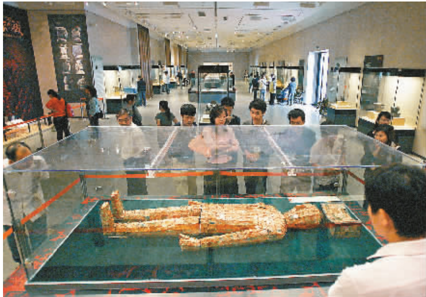
国宝展昨天开展。图为观众在欣赏汉代金缕玉衣的精细与华美。