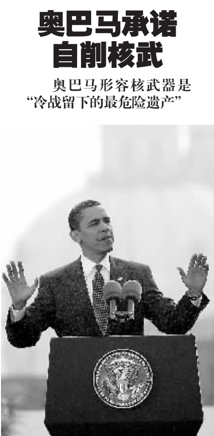
4月5日，美国总统在捷克首都布拉格发表演讲。

奥巴马承诺自削核武 奥巴马形容核武器是“冷战留下的最危险遗产” 新华社专电 在捷克首都布拉格出席美欧峰会的美国总统贝拉克·奥巴马5日发表公众演讲说，美国将致力于减少核武器，严厉惩罚那些违反相关不扩散核武器条约的国家。 上万捷克人当天聚集在布拉格城堡前的广场上，聆听奥巴马演讲。 奥巴马形容核武器是“冷战留下的最危险遗产”，“美国政府将采取实际行动，建立一个没有核武器的世界”。 奥巴马同时承诺，美国将削减核武器。 “有人认为，核武扩散无法阻止，因为当今世界越来越多国家和人民渴望拥有这种终极武器，”奥巴马说，“上述宿命论其实自相矛盾，因为如果承认核武扩散不可避免，就相当于告诉自己，使用核武同样不可避免。” 有意思的是，奥巴马演讲所处之捷克，正是美国在全球部署导弹防御系统两个东欧支点之一，而在东欧部署导弹防御系统也是招致美国和俄罗斯在数年前关系冷却的最主要原因。 奥巴马当天承诺，如果来自伊朗的威胁得以消除，美国可叫停导弹防御系统。“只要伊朗核威胁还在，我们就会推进部署导弹防御系统。威胁一旦消除，美国就拥有更安全的外部环境，在欧洲部署导弹防御系统的动机也随之消失。”