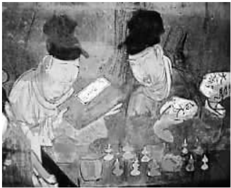
↑手拿大黄、白术两袋中药和手捧宋代最著名医书《太平圣惠方》的两个男子。

本报讯 据《光明日报》4月11日报道,陕西省考古研究院在韩城市盘乐村发现了一座保存完整的宋代壁画墓,发现了极其罕见的宋代木榻实物,首次发现了表现中医中药的整幅绘画作品,首次发现了目前最完整的宋代戏剧场面。陕西省文物局和考古院有关考古专家和文保专家一致认为,这一墓壁画色彩艳丽,技法娴熟,题材广泛,内容丰富,当为国内宋代考古的重大发现。 盘乐村位于陕西省韩城市新城区东南部,东距黄河约3公里。2008年11月,陕西省考古研究院配合韩城矿务局沉陷区工程建设在此进行考古钻探,共发现从汉代延续至清代的古墓葬47座。今年2月,考古院组队对这里的古墓葬进行清理,在盘乐村东300米处发现的一座宋代壁画墓,由于墓室未遭受淤土浸扰和人为盗掘,墓内壁画以及木榻等遗物保存完好。 清理后发现,这一壁画墓为砖券墓室,墓主为夫妇合葬,骨骼已完全腐朽,但仍能分辨出葬式为仰身直肢,头向北,头发尚存,另外,女墓主所穿的一双鞋依稀可见,鞋长18厘米。墓室中砖砌榻座及木榻保存基本完好,木榻长2.05米、宽0.94米,造型挺秀、装饰简洁,不作大面积的雕镂装饰,只取局部菊花装饰。国内同时期考古发现中宋代木榻实物极其罕见,这为我国古代家具研究增添了相当珍贵的实物资料。 整个墓室为磨砖对缝,壁面似做处理,