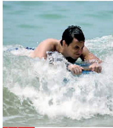
戏浪 4月14日,大东海波涛起伏,一外籍游客惬意戏浪。