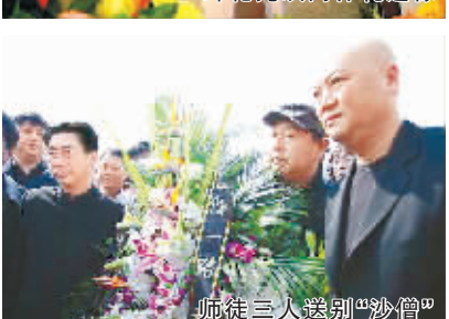
师徒三人送别“沙僧”