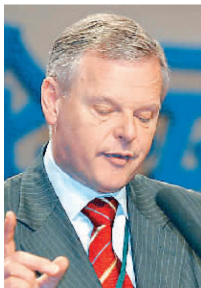
柯兹雷 荷兰飞利浦总裁