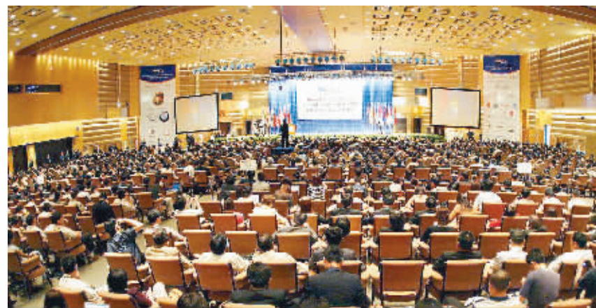
2004年年会与前两届相比,多个方面达到前所未有的高水平。日趋成熟的博鳌亚洲论坛,正在向世界级的国际论坛迈进。