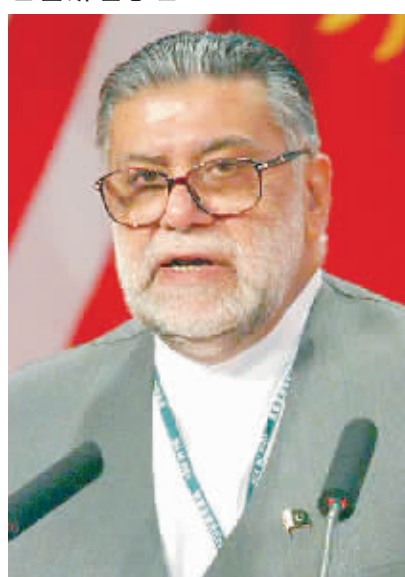
贾迈利 巴基斯坦总理

亚洲要实现共赢,必须坚持可持续发展,强调和睦相处。纵观全球经济发展,基于亚洲的这种可持续价值是极好的一种模式。