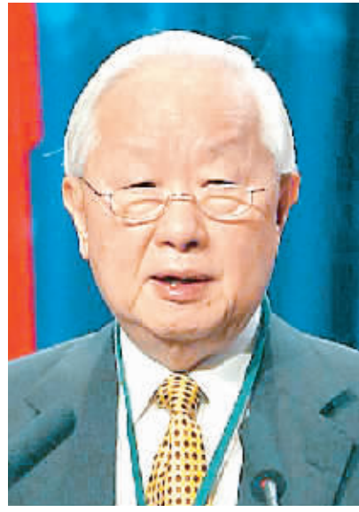
张忠谋 中国台湾积体电路公司董事长

全球化时代,必须尊重不同的文化、传统和价值观。用宽容和耐心来揭示这些不同文化、传统和价值观中的普遍性。