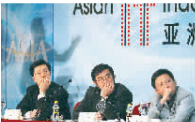
IT产业人士纵论信息技术市场。