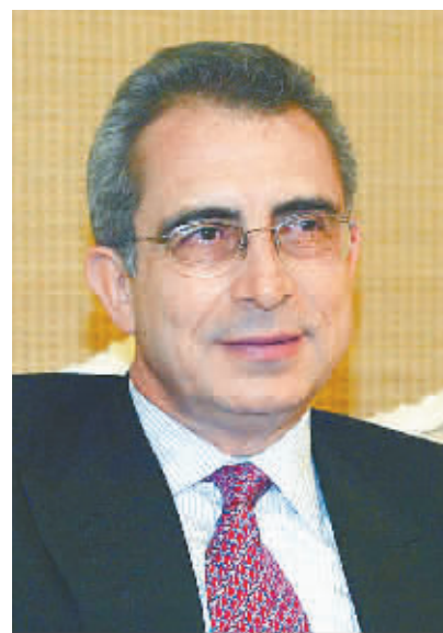
塞迪略 墨西哥前总统

亚洲区域经济一体化会使亚洲这个市场变得更大,各国的交流会更直接,这一点非常重要。