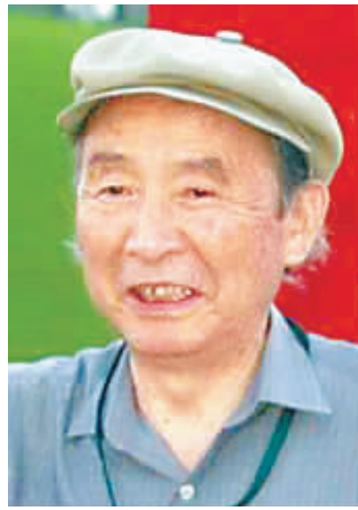
根本二郎 日本邮船株式会社名誉会长

全球化时代,必须尊重不同的文化、传统和价值观。用宽容和耐心来揭示这些不同文化、传统和价值观中的普遍性。