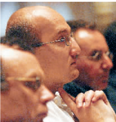
聚精会神倾听亚洲声音。