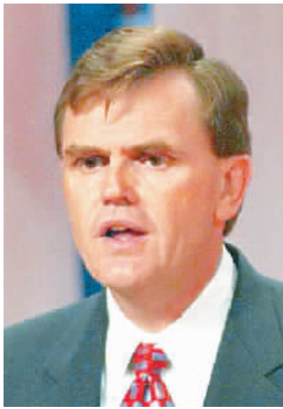
大卫·艾博尼 美国UPS总裁

亚洲区域经济一体化会使亚洲这个市场变得更大,各国的交流会更直接,这一点非常重要。