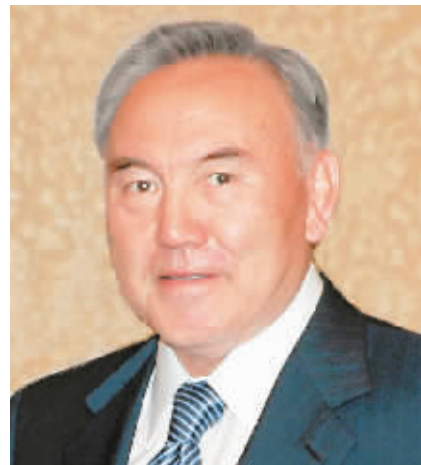
哈萨克斯坦总统 纳扎尔巴耶夫

巴基斯坦已故前总理贝·布托的丈夫。他曾担任巴国民议会议员、投资部长、环境部长、参议员等职。2008年1月，扎尔达里出任人民党联合主席。2008年9月，他在总统选举中获胜，当选巴第12任总统。扎尔达里对华友好，曾先后3次访华。