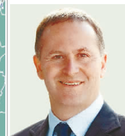
新西兰总理 约翰·基

1944年10月15日出生，1992年，贝里沙当选总统。1997年6月，在选举当中，社会党赢得胜利，贝里沙不得不离开总统位置。在2005年选举中，他获胜成为总理。