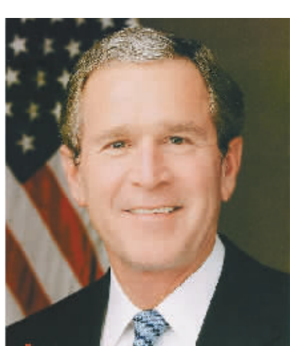
美国前总统 乔治·沃克·布什

1936年7月16日出生，2007年9月25日出任第91任日本首相。2008年8月，福田康夫来北京参加第29届奥运会开幕式及相关活动。