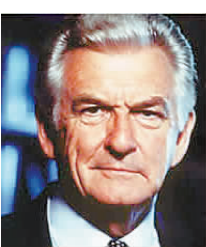
澳大利亚前总理 霍克

1951年3月30日出生，哈萨克斯坦独立后的前三年间(1991.10—1994.10)任哈萨克斯坦共和国政府总理。