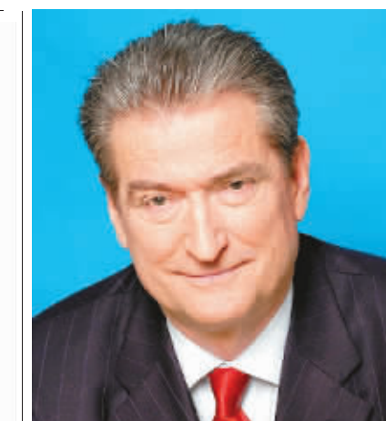
阿尔巴尼亚总理 贝里沙

1944年10月15日出生，1992年，贝里沙当选总统。1997年6月，在选举当中，社会党赢得胜利，贝里沙不得不离开总统位置。在2005年选举中，他获胜成为总理。