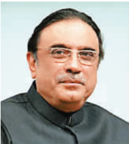
巴基斯坦总统 扎尔达里

巴基斯坦已故前总理贝·布托的丈夫。他曾担任巴国民议会议员、投资部长、环境部长、参议员等职。2008年1月，扎尔达里出任人民党联合主席。2008年9月，他在总统选举中获胜，当选巴第12任总统。扎尔达里对华友好，曾先后3次访华。