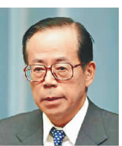
日本前首相 福田康夫

1928年3月18日出生，历任总统军事助理、情报局长、步兵旅长、武装部队副参谋长、参谋长、保安军司令等军事要职。1992年6月出任菲律宾总统，1998年6月去职。