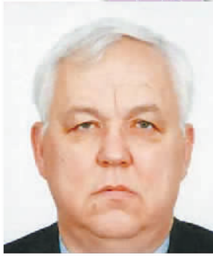
哈萨克斯坦前总理 捷列先科

1961年出生，2006年11月，他当选国家党领导人。2008年11月，由约翰·基领导的主要反对党国家党在议会选举中击败执政党工党，赢得政府组阁权。约翰·基出任新西兰新一届政府总理。