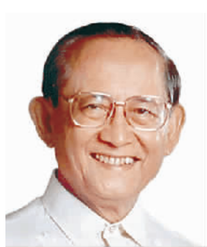
菲律宾前总统 拉莫斯

1983年至1991年担任澳大利亚总理，国际上著名的政治家和经济学家，在中国知名度很高。霍克是APEC会议的发起人。