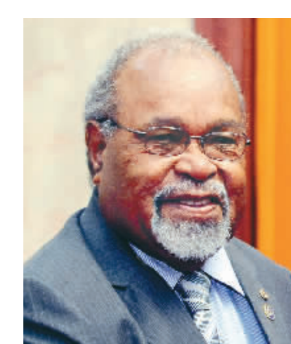
巴布亚新几内亚总理 索马雷

伊朗实行总统内阁制，总统可授权第一副总掌管内阁日常工作，并有权任命数名副总统。2007年11月3日，他曾作为观察员国代表参加上合组织成员国总理第六次会议。